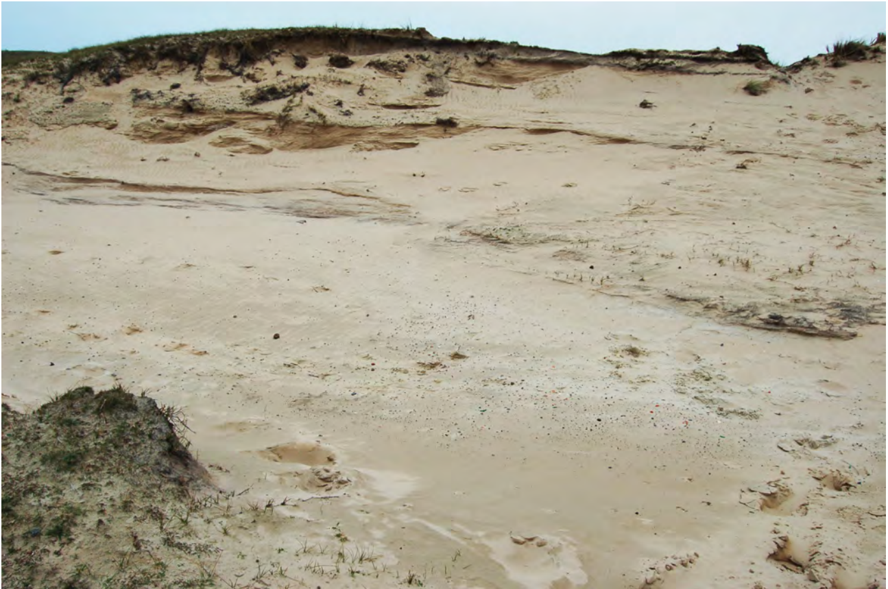
Fig. 4 Scherven in een stuifkuil: een kijkgat door de Jonge Duinen op het landschap van de Oude Duinen. Nabij de Bloedberg, Solleveld, 6 november 2011.

beeld van de bewoning voor het jaar 1000 nog verder ingekleurd zal gaan worden. Door oplettendheid van bezoekers en duinwachters voor archeologische sporen en losse vondsten zal er meer bekend kunnen worden over de pre- en protohistorische bewoning onder en naast de huidige duinen.