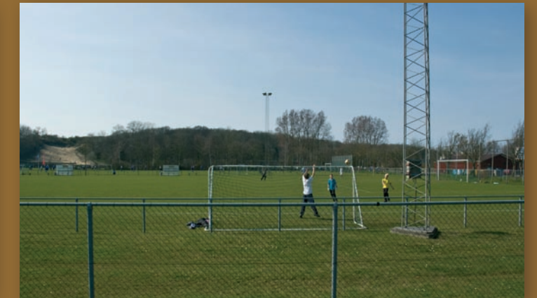
Gezicht op de Papeenberg, Castricum vanaf de Rijksstraatweg. Links circa 1930. De lokale zandafgraving is anno 2009 een klimduin. De duinhelling is bebost en het vochtige weiland werd een sportveld met GSM-mast.