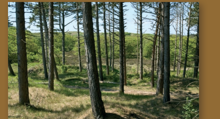
Gezicht op Verbrande Pan met natuurlijk eikenberkenbos. Links, ca 1950, is het huisje nog zichtbaar en er staan net zwarte dennen in de grond.