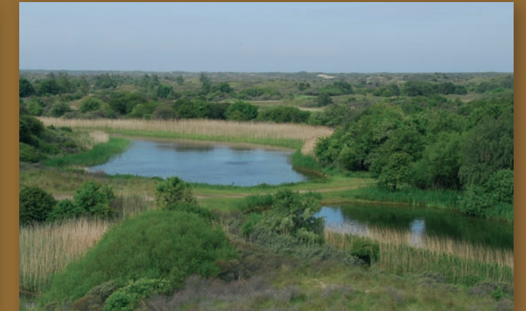
Uitzicht vanaf Berg van het Westend (Amsterdamse Waterleidingduinen) in 1976 en 2009. Van open naar deels gesloten met riet, struweel en bos.