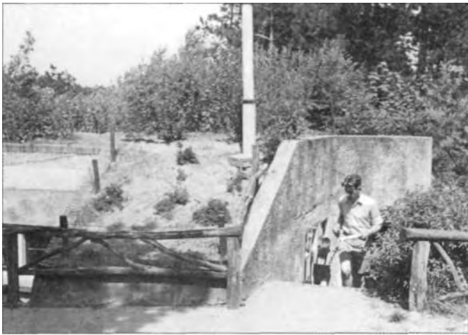
Uitgang van de bunker die dienst deed als postkantoor.

Te kampeertreinen in het land. Het verhaal wil echter dat de meeste weggestuurde kampeerders heel handig waren in het omzeilen van de controle door gewoon een andere naam op te geven. Zodoende stonden sommigen naar eigen zeggen wel onder drie of vier verschillende namen in het zwartboek vermeld.