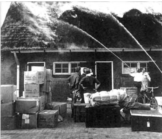
Brand in Loods 1 op 10 augustus 1965.

Op 3 april 1973 werd Kamp Bakkum opgeschrikt door een hevige orkaan. Hierdoor werden maar liefst 250 van de 500 huisjes tegen de grond geslagen en 1200 bomen ontworteld. Peter Vos was nog maar net aangesteld als beheerder en moest alle zeilen bijzetten om mensen te mobiliseren en te motiveren. Hij sloeg zich er echter voortreffelijk