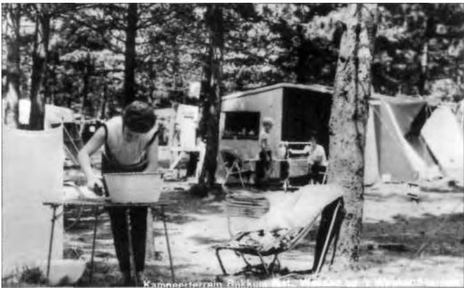
Toen had moeder nog 'wasdag' en zat vader op zijn werk.