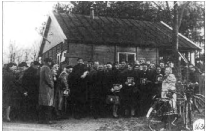
Zoekdag 18 maart 1950.

De capaciteit is inmiddels voldoende ruim en iedereen slaagt er doorgaans in een plek van zijn of haar gading te vinden.