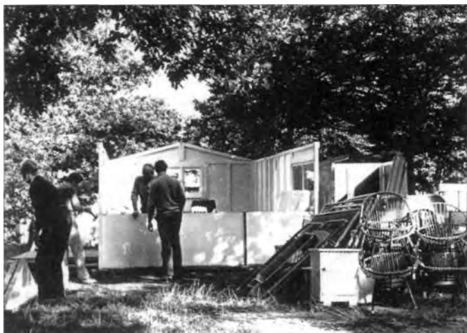
"Ik mot me huissie in de oorspronkullukke staat oplefere"

De bijzondere band en leefwijze binnen de kampbevolking was midden jaren negentig aanleiding en gaf stof genoeg voor het maken van de tv-serie 'De camping'. In acht boeiende afleveringen liet men toen het wel en wee van de Amsterdammers op Bakkum zien. De ouderen