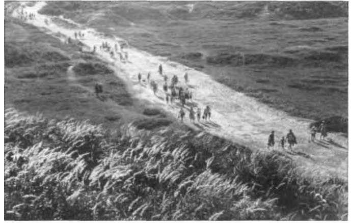
De Grote Veldweg, al jarenlang een rechtstreekse verbinding met het strand.