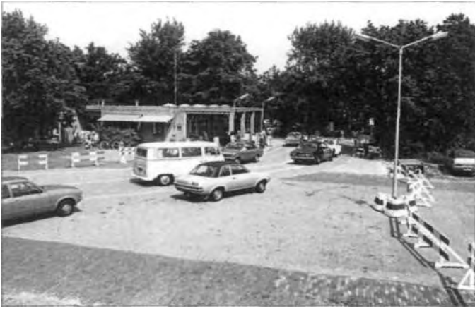
Ook op Kamp Bakkum groeide het auto-bezit.