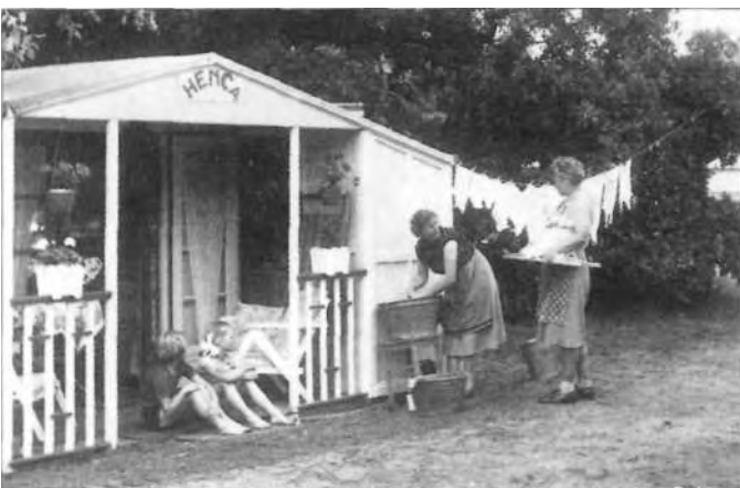
Even buurten in de Amsterdamse wijk.

Over de hoogte van de tarieven is in de loop der tijd het nodige te doen geweest. In 1937 vond de krant Het Volk dat het kamp te duur was, omdat een 'ingezonden brief-schrijver had uitgerekend dat een gezin met drie of vier kinderen f 7,75 of f 9,50 per week kwijt was, een hoger bedrag dan de huur van een middenstandswoning in de stad. Daarentegen had een journalist van dezelfde krant in 1930 geschreven hoe goedkoop het kamperen in Bakkum was vergeleken met andere kampeersereinen. Het Parool van 30 juni 1950 klaagde dat het PWN de prijzen geleidelijk had opgeschroefd, waardoor arbeiders verdrongen werden en men steeds meer luxe wagens op het kampeerserein zag verschijnen. "Je reinste centenvangerij", citeerde de krant een kampeerser. En de krant schreef verder: "Maar deson-