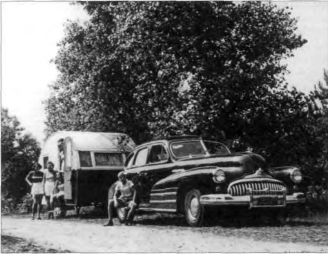
Een mobiele kampeersfamilie in 1950.

van de gemeente werd geschreven, vermeldde een capaciteit van 8000 personen en 1750 staanplaatsen, waarvan er circa 1500 bestemd waren voor statische kampeersers en de rest voor mobiele kampeersers, hetgeen ook in 2002 nog het geval was. Verder vermeldde de nota dat de kampeerssector vooral door het kampeerserein Bakkum een grote invloed bleek te hebben op de gastenstructuur van de gemeente Castricum. Ook was vastgesteld dat de verblijfsrecreanten op het terrein binnen een straal van 30 kilometer rondom Castricum woonden, hetgeen hoofdzakelijk te maken had met het grote aantal Amsterdamse bezoekers. Voor deze Mokkumers, grotendeels afkomstig uit de arbeidersklasse, was Bakkum de voor- en achtertuin die zij op hun knellende etagewoninkje in de bomvolle binnenstad ontbeerden. Zij hechtten er grote waarde aan tussen hun stadgenoten te staan, zodat zelfs wijken ontstonden van Amsterdammers en Zaankanters.