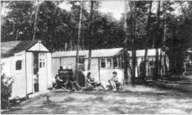
De 'zomerpaleisjes' zijn weer opgebouwd.

'zomerpaleisjes" in de toch al krap bemeten Amsterdamse bovenwoningjes of zelfs op het dak.