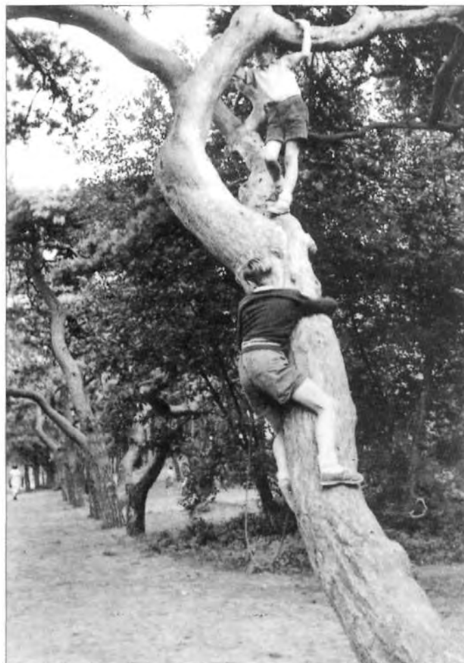
De beruchte 'apenbomen'.

Tegenwoordig gaat er alleen nog een kanariepietje mee, dat regelmatig uit zijn kooi mag mits deuren en ramen zorgvuldig gesloten zijn. Ook de fototentoonstelling 'Groeten uit Bakkum', die van juli tot september 2002 werd gehouden in bezoekerscentrum 'De Hoep', liet duidelijk zien hoe groot de rol is die Bakkum speelt in de levens van vele Amsterdammers. Bij de opening van de tentoonstelling omschreef de burgemeester van Castricum het kampeerterrein dan ook terecht als 'Klein Mokum'. Op de foto's stonden diverse trouwe campinggasten die al zo'n 30,40 of zelfs 70 jaar in Bakkum komen, doorgaans onder het motto: "Als je 2-hoog in de stad woont, dan is Bakkum toch het paradijs?"