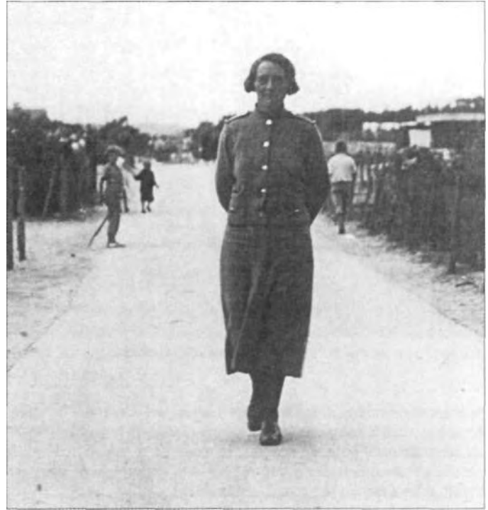
Kampwacht Maria Brakenhoff in 1934.

danks blijven de mensen komen. Als het terrein in de lente weer geopend wordt, trekken zij als Mekkagangers naar Bakkum, waar je 's avonds tussen de verdroomde bomen een enkele Jordaanse trekharmonica een weemoedig levenslied kunt horen spelen. Heel zachtjes. Want de mensen zitten hier en bloc van de stilte te genieten."