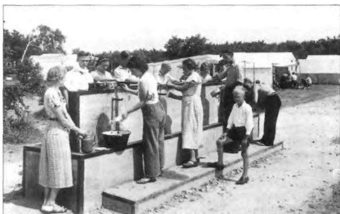
Heerlijk helder duinwater.

ner van het aan de Zeeweg gelegen 'Commissarishuis', verkocht in die periode onder andere stro, chocola en frisdrank aan de kampeerdere.