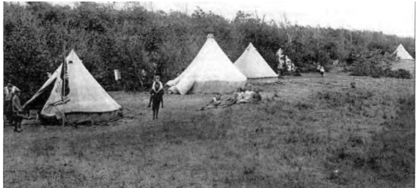
Kamperen in de tijd dat het Bakkumlied werd geschreven.