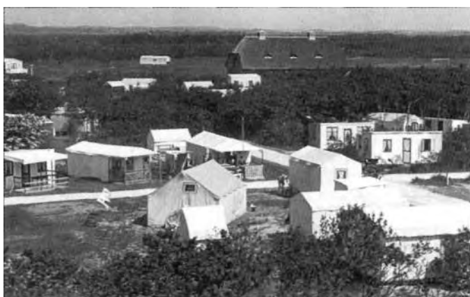
Overzicht vanaf het dak van Loods 1 in 1937.

De originele houten huisjes zijn er nog steeds volop te vinden. Deze worden elk jaar omstreeks 15 maart opgebouwd en dan weer vóór 15 oktober afgebroken om ze vervolgens op te slaan. Voorheen werd er de hele winter aan het huisje geklust en om die reden stonden de vele