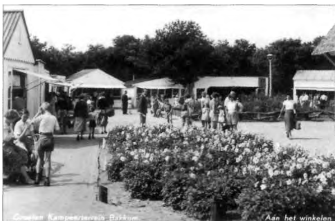
Aan het winkelen in de vijftiger jaren.

In de beginperiode waren de kampeerders voor de boodschappen op het kampeerterrein nog aangewezen op de winkels van Bakkum, die hierdoor in de zomermaanden goede zaken deden. Voor de oorlog bestonden er echter al enkele winkeltjes op het kamp, waar alles te koop was wat de kampeerders nodig hadden. Ook kon men zich door de barbier glad laten scheren. Nadat de winkeltjes na de oorlog nog enige tijd in bunkers waren ondergebracht, werden er spoedig voor die bestemming houten keetjes gebouwd. Hierin vestigden zich onder andere een bakker, een kruidenier en een petroleumhandelaar. De middenstanders uit het dorp konden zich hiervoor jaarlijks laten