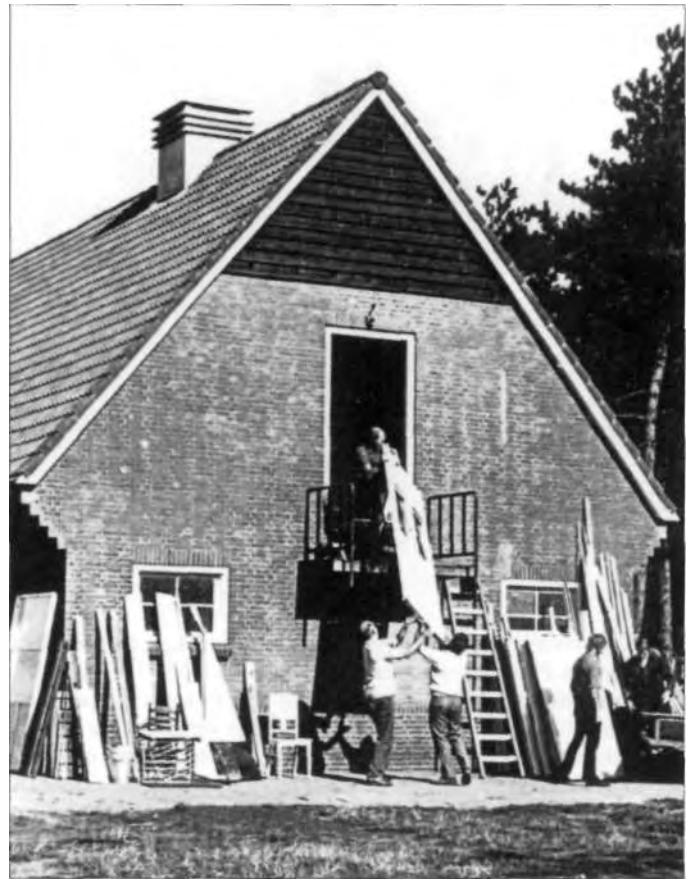
Meer ruimte om de kampeermaterialen op te bergen.

In de loop der tijd werd er van alles bijgebouwd op het terrein. Er kwam een extra schuur om de kampeermaterialen op te bergen, een schaftlokaal en een bergplaats voor het stro waarmee de kampeerders