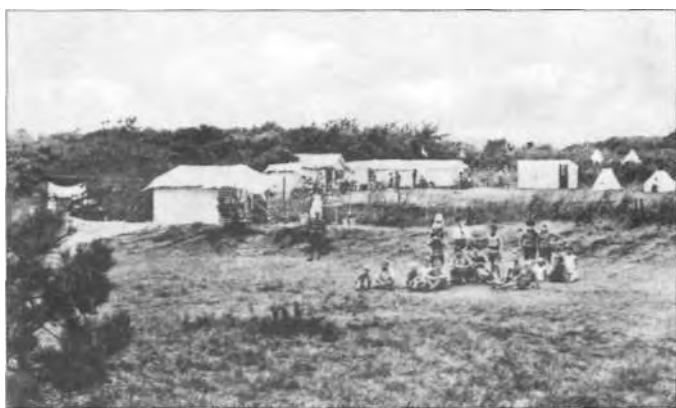
Kamperen op Bakkum anno 1932