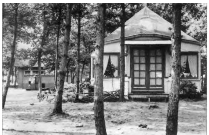
De tenthuisjes werden elk jaar mooier.

Het Algemeen Dagblad schetste in 1950 hoe in het vroege voorjaar het 'villadorp' weer werd opgebouwd. Over een vrouw die aan het