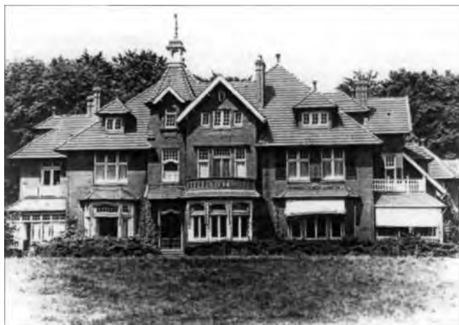
Villa Koningshof in Overveen.