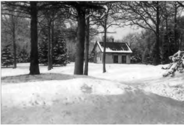
Het jachthuis aan de Oude Schulpweg in de sneeuw.

wel over die weg naar en van zijn huis zal mogen rijden. Verder wordt overeengekomen dat het jachtrecht op het verhuurde terrein door provincie niet aan derden zal worden verpacht en dat de huurder gerechtigd is er te jagen op schadelijk gedierte, met uitzondering van fazanten. Fazanten kunnen eventueel weer wel door de huurder worden opgeruimd, met speciale toestemming van de provincie.