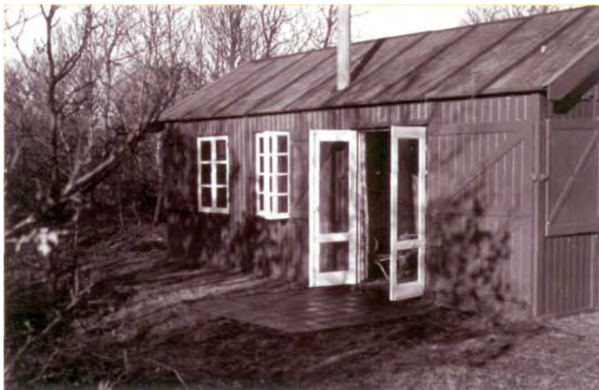
Het 'huisje van Sandberg', waar de jonkheren Sandberg en Röell meestal verbleven, stond achter 'Kijk Uit'. Het was zowel met antiek als met modern meubilair ingericht (foto Stedelijk Museum).

Het volgepakte interieur van de kelder waarin nauwelijks ruimte was voor de beambte. Links ligt op de voorgrond de opgerolde Nachtwacht en daarachter staan stalen kasten met kostbare boeken en plaatwerken. Rechts kisten met kunstvoorwerpen en op de achtergrond de stalen rekken met schilderijen (foto Stedelijk Museum).