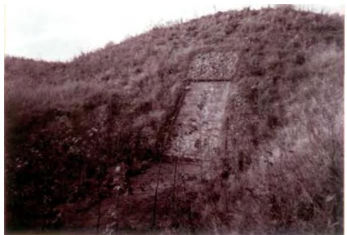
De gecamoufleerde ingang van de kluis aan de hel/uweg in het Geversduin. De bouw is op 1 januari begonnen en op 10 april 1940 voltooid.

De gemeente Amsterdam bereikte overeenstemming met het Provinciaal Waterleidingbedrijf over de plaats en de directeur Publieke Werken vroeg op 17 oktober 1939 bij de gemeente Castricum vergunning voor de bouw van een 'betonnen bergplaats aan de Helmweg in het Geversduin'. Het gemeentebestuur verleende de bouwvergunning nog diezelfde dag. Omdat op geheimhouding was aangedrongen, verwonderden de bestuurders zich er wel over dat de Beverwijksche en de Alkmaarsche Courant het nieuws van de bouw van de 'schatkelder' al op 21 oktober 1939 publiceerden.