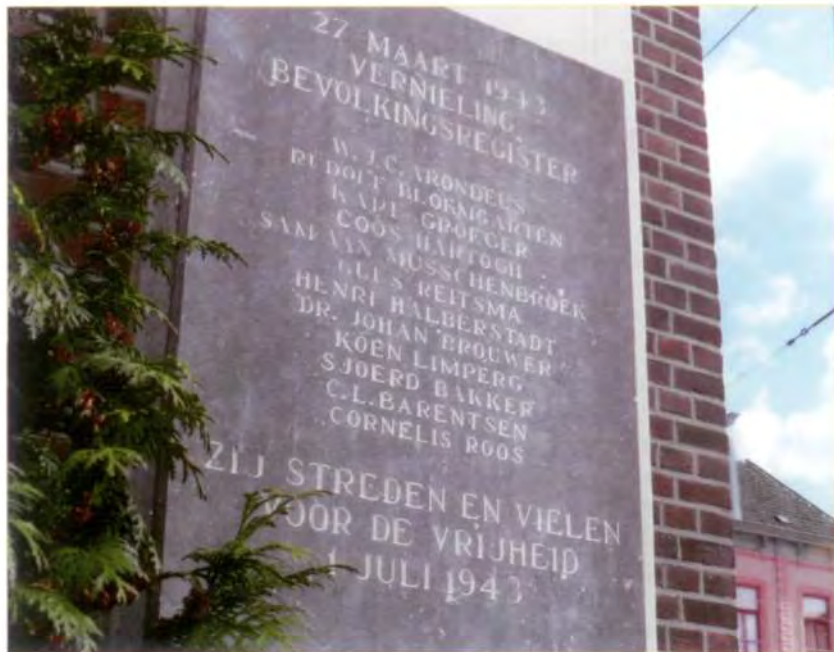
Door Sandberg ontworpen gedenksteen met de namen van de verzetsstrijders die de aanslag op het bevolkingsregister van Amsterdam uitvoerden. De steen is aangebracht op de gevel van het voormalige bevolkingsregister, de huidige studio Plantage naast de ingang van Artis.

Joden werden van een andere identiteit voorzien, ook degenen die voor de arbeidsdienst naar Duitsland dreigden te worden gestuurd en verzetsmensen. De valsheid van de persoonsbewijzen kon moeilijk worden vastgesteld, maar men kon ze wel altijd verifiëren op het Bevolkingsregister.