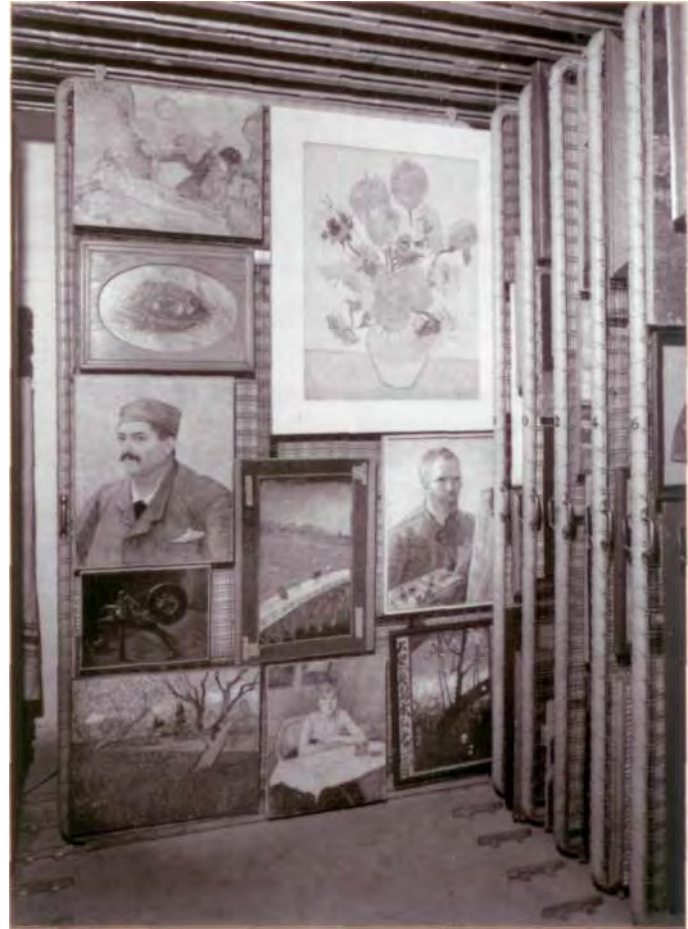
Achterin de kluis de uitschuifbare rekken met schilderijen. Te herkennen zijn schilderijen van Van Gogh en in het midden op de onderste rij een werk van Toulouse-Lautrec.