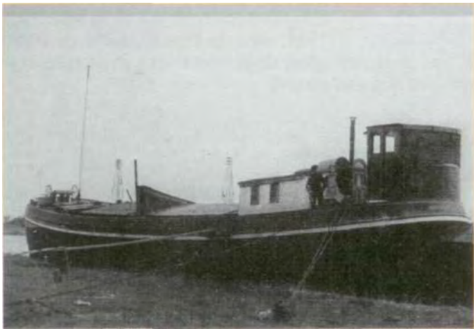
Een van de schepen afgemeerd in de buurt van het Alkmaardermeer, waarin de kunstschaten van het Stedelijk Museum tijdelijk werden bewaard, totdat zij naar de bomvrije kluis in Castricum konden worden overgebracht.

Op 28 augustus 1939 werden de eerste verhuiswagens geladen. Eerder waren de kunstwerken naar belangrijkheid in drie categorieën ingedeeld. Rood stond voor onvervangbaar; wit voor belangrijk en blauw betekende vervangbaar. Israëls, Breitners, Van Goghs en andere werden opgeborgen in het ruim van de Dankbaarheid. In het ruim van de Mercurius en dat van De Morgenster werd ook een deel opgeslagen, samen met werk van Mondriaan, Charley Toorop en andere moderne kunstenaars. Het was zoveel dat tenslotte nog een vierde schip in gebruik is genomen, de Harwu Almie.