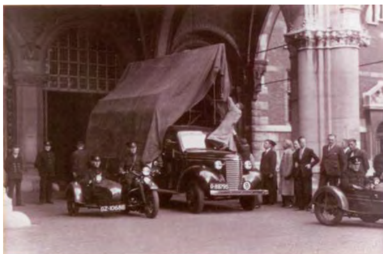
Met deze wagen en op dezelfde manier werd op 4 september 1939 de Nachtwacht naar kasteel Radboud in Medemblik gebracht en vervolgens op 13 en 14 mei 1940 naar Castricum.

De Nachtwacht stond begin mei 1940 nog in de ridderzaal van kasteel Radboud. De aanwezigheid van een mijnenveger in de haven van Medemblik baarde zorgen. Het schip zou vijandelijke vliegtuigen kunnen aantrekken, waardoor het kasteel en dus de kunstwerken gevaar liepen. Dat het gevaar niet denkbeeldig was, bleek ook wel, want de mijnenveger beschoot daadwerkelijk een vliegtuig, dat waarschijnlijk in het IJsselmeer terechtgekomen is. Bij Kornwerderzand op de Afsluitdijk was het Nederlandse leger in gevecht met de Duitsers. Een doorbraak van de vijand naar Noord-Holland was te verwachten. Op 13 mei, tweede pinksterdag, nam de hoofddirecteur van het Rijksmuseum dr. Schmidt Degener het besluit om de Nachtwacht naar de bergplaats in Castricum te brengen. Hij nam daarmee een zware verantwoordelijkheid op zich. De oorlog was heel dichtbij.