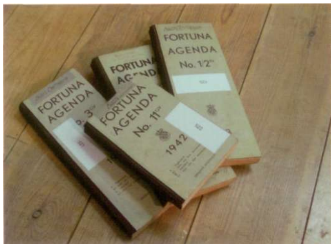
De logboeken van 1940 tot en met 1943.

De eerste schilderijen van de schepen werden vanaf begin april naar de kluis gebracht. Op 7 mei kwam volgens de agenda het laatste transport aan. Ook zaken die nog in het Stedelijk Museum waren achtergebleven, werden aangevoerd.