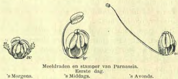
Meeldraden en stamper van Parnassia. Eerste dag.

't Aardigst aan de Parnassia is, dat ze elke dag er anders uitziet dan de vorige. De knop zelfs is al mooi: een witte bol, op 't laatst zoo groot als een knikker, ligt in een beker van groene kelk-slippen. 's Nachts of heel vroeg in den morgen ontluikt de bloem, de bloembladen spreiden zich uit en ge ziet de dikke witte meeldraden tot een kroontje saamgevoegd midden in de bloem liggen;