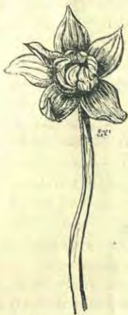
Abnormale bloem van Parnassia met 6 kelkbladeren en 6 groen en wit gestreepte kroonbladeren \times \frac{1}{2}

Maar dat alles neemt niet weg, dat er geen enkele plant is, die wat het maaxsel van de bloem betreft op Parnassia lijkt; al solt men het plantje in de boeken van de eene kant naar de andere, het wordt er niet mooier en gelukkig niet leelijker en niet anders door. Er is nog zoo'n unicum in onze duinboschjes te vinden, maar juist in 't vroege voorjaar, niet in de herfst; 't is Adoxa , een waardig pendant van Parnassia , wat merkwaardigheid van bouw betreft, maar uiterlijk schoon bezit Adoxa niet. Wie van u wat Grieksch verstaat, ziet dat dadelijk in, want Adoxa beteekent: „zonder praal.” In 't voorjaar zullen we die wel eens samen zoeken.