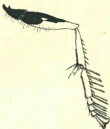
Voorpoot van de Harkwesp.

Natuurlijk heeft hij mijn merksteen niet noodig gehad, om zijn huis te vinden. Evenals alle graaf-