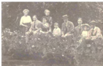
Om 'n buuppelje ovec de kerkade :

Onse Feldt Ad Arcevaud Vader Seheln PL. AL PL PL Henry Geest PL