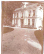
Het Oude Huis van 1814

Aquarel van Meester Van der Meer. Dezelfde architect op de linker