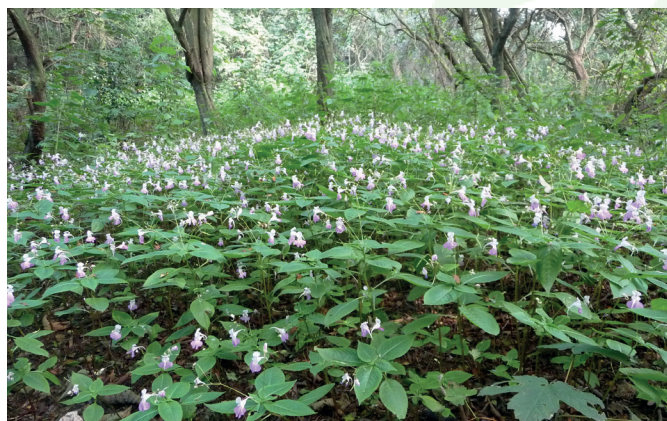
Groeiplaats van Tweekleurig springzaad in de Kapittelduinen – foto Niels de Zwarte / Bureau Stadsnatuur

Is deze nieuwe soort een aanwinst of een bedreiging voor onze wilde flora? Tot dusverre zijn de groeiplaatsen bescheiden van omvang en worden geen groeiplaatsen van inheemse planten bedreigd, maar dat kan veranderen. In Frankrijk is Tweekleurig springzaad al langer te vinden en is sprake van inburgering langs rivieren. Het is ons niet bekend of de soort daar als 'probleemsoort' wordt gezien. In Nederland lijkt de soort zich te beperken tot relatief warme gebieden langs de