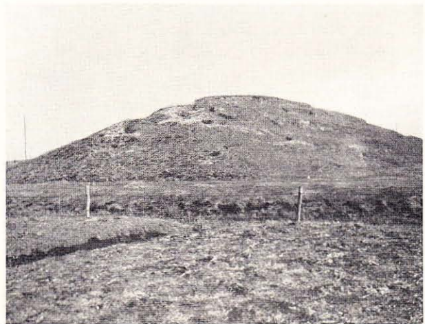
Een „nol” in het Callantsoogsche duin leent zich uitstekend als tee.

Willem de Boer is een interessant type. Een