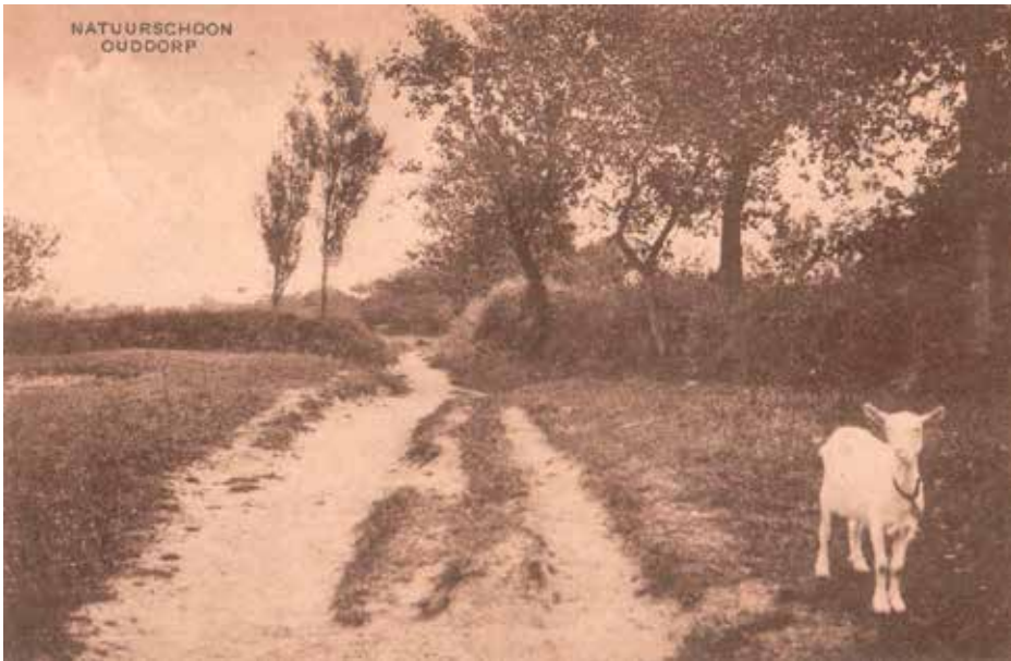
Wallenlandschap bij Ouddorp 1927

brandhout voor de bakkersovens in het dorp. Deze wisselbouw op 'duinakerweilanden' in de binnenduinen was min of meer zelfvoorzienend. Bij de boerderij was een 'hof' of moestuin voor eigen gebruik. De lage met doornstruiken beplante schurveling was belangrijk als veekering, maar ook als zand- en windvang en als eigendomsgrens. Tegenwoordig zijn er rond Ouddorp nog enkele kilometers schurveling bewaard gebleven.