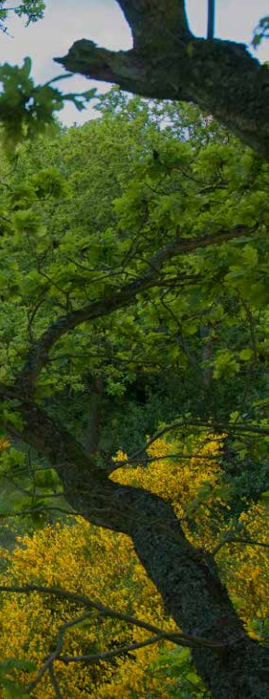
Houtwal met eiken en bloeiende brem naast een 'mieneg' op de Kleistee bij Ouddorp, door maai-beheer is het nu een kruidenrijk grasland.

duiden op een ouderdom uit de zesde tot achtste eeuw. Later, in de dertiende tot vijftiende eeuw, werd een nieuwe strandhaak met hogere duinen aan de Noordzeekant gevormd. Daardoor werden de Oost-, Middel- en Westduinen toen binnenduinen. Ouddorp wordt al in een oorkonde uit 1105 genoemd en we mogen er van uitgaan dat het omliggende cultuurlandschap in de eeuw ervoor tot stand is gekomen. Dat klopt met gevonden scherven van Pingsdorfaardewerk uit die tijd. De boeren egaliseerden en begreppelden het binnenduin en brachten de schrale top laag op een lage zandwal, met terzijde twee greppels. Dit gebied met bochtige wegen en onregelmatige blokken land, heette het Oudeland van Diepenhorst. In de Oude Nieuwlandpolder uit 1357, ten noorden van Ouddorp, werd het binnenduin ook in cultuur gebracht. De begreppelde akkertjes werden haameet ('haemete') genoemd en de omringende lage zandwal heette schurveling ('schurvelienk'). Op het naastgelegen eiland Schouwen lagen vergelijkbare duinakkers, hier 'haaimannen' genoemd.