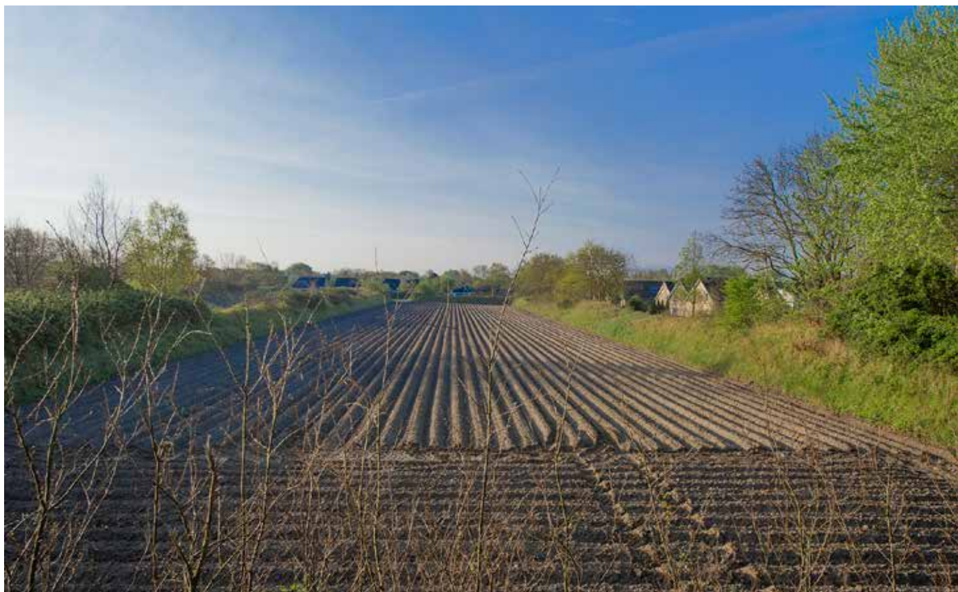
Uitgemijnd land met vroege aardappelen tussen zandwallen achter de Dijkstelweg in Ouddorp

Op de diep gelegen tuinbouwgrond teelde men arbeidsintensieve gewassen als vroege aardappelen, sjalotten, graszaad en bloemzaden zoals slaapmutsjes en Oost-Indische kers. In een paar jaar had men zo de kosten van het uitmijnen terugverdiend. Deze alom aanwezige zandwallen geven het landschap een bijzondere aanblik, die je nergens anders langs de Nederlandse kust ziet. Ten onrechte worden ze ook wel schurvelingen genoemd. Vroeger stond op de 'hoagte' vaak een geit aan een ijzeren pin. Tussen de wallen lopen soms smalle paden die op een holle weg lijken. In 1953 zijn enkele hoogten afgegraven voor zandwinning. Later zijn ze nog afgegraven voor dijkverzwaringen en de aanleg van de N57. Er is nog ongeveer honderd kilometer van deze hoge zandwallen aanwezig. Een andere verbetering van de landbouwgrond rond Ouddorp was het omhoog halen van kleigrond ('spier') en het omlaag werken van het oppervlaktezand. Dit gebeurde tussen 1910 en 1930 aan de zuidkant van het dorp, waar onder het duinzand schorklei lag. Dit 'omzetten' ging wel