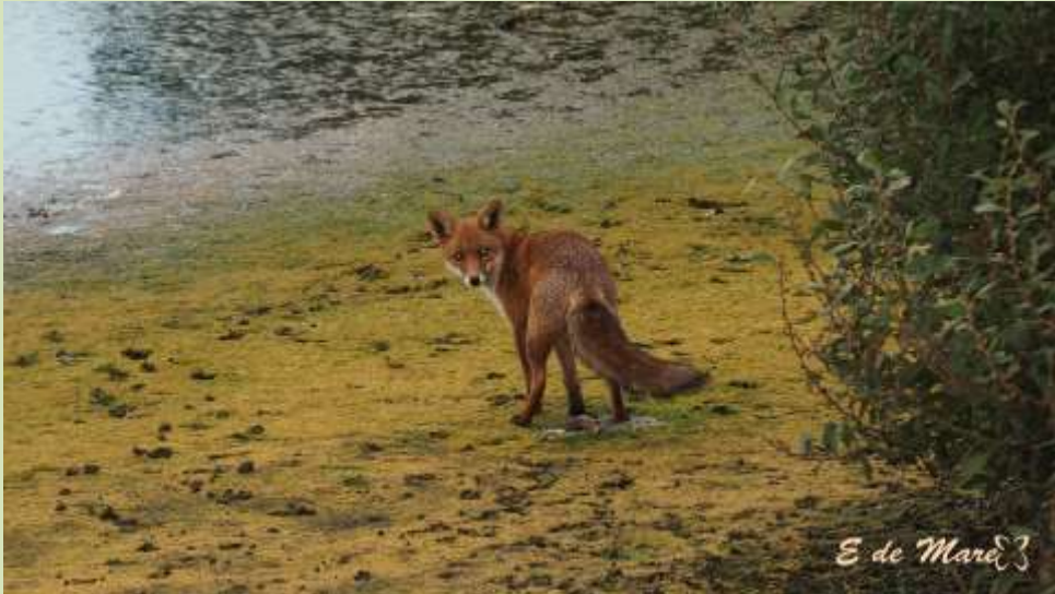
Vos op drooggevalle oever van het Quackjeswater, 8 oktober 2018.