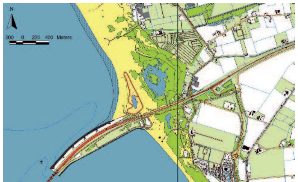
Fig. 1. Ligging van de Jaap van Baarsenvalei (rood gearceerd) op Voorne. Het rode vlakje is het zout proefvlak.

Het random uitgekozen stuk verschilde op het oog niet van de omgeving. De nulsituatie is niet vastgelegd, maar het stuk en de omgeving waren sterk begroeid met lage wilgen. Bij een veldbezoek op 3 augustus 2005 werd duidelijk dat het zeer succesvol was. De wilgen waren verdwenen in het vlak, terwijl diverse andere soorten nog (of weer) aanwezig waren. Ook was in 2005 nog goed te zien dat niet alleen het behandelde proefvlak, maar ook de baan waarlangs water vanaf het proefvlak naar het meertje stroomt sterk onder invloed van het zout had gestaan. Deze strook was eveneens vrij van wilgen (foto 1 en foto 2)! Dit was aanleiding om de ontwikkelingen beter te gaan volgen. Op 3 augustus 2005 zijn vier vegetatieproefvlakken met de Braun-Blanquet schaal opgenomen. Twee in het zoutvlak zelf, een direct ten zuiden van het zoutvlak en een direct ten noorden van het zoutvlak, allemaal op dezelfde positie op de flauwe helling. Deze proefvlakken zijn ook op 31 juli 2008 (foto 3)