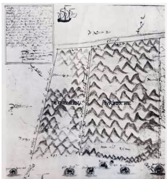
Figuur 1. Kaart van de Gemene Jurisdictie door Floris Jacobs (1602). Nationaal Archief (uit Boerboom 1958).

Dankzij een grensgeschil tussen Delfland en Rijnland is er een kaart van de 'Gemene Jurisdictie' door Floris Jacobs uit 1602 (Boerboom 1958, 15-17). Het betwiste rechtsgebied van bijna drie kilometer liep van de Schevelincksepan tot