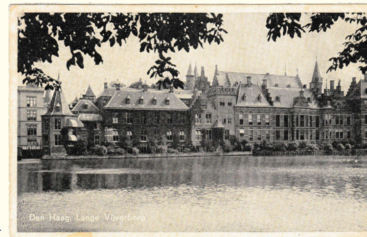
Foto Hofvijver ca. 1940