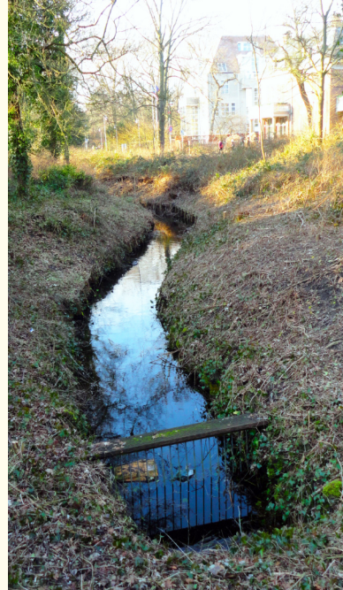
Diep gelegen Beek langs Rustenburgweg.

In 1345 werd het Spui gegraven voor de afvoer van het grachtwater naar de Vliet. Waarschijnlijk werd toen ook de aanvoer van schoon water vanuit het natte Segbroek gegraven. De genoemde sloot werd over een afstand van bijna een kilometer door de binnenduinen naar het Segbroek verlengd, waar die aan-